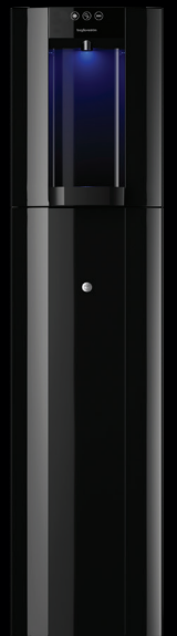
Zwart – Vloeropstelling