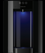
Zwart – Aanrechtmodel